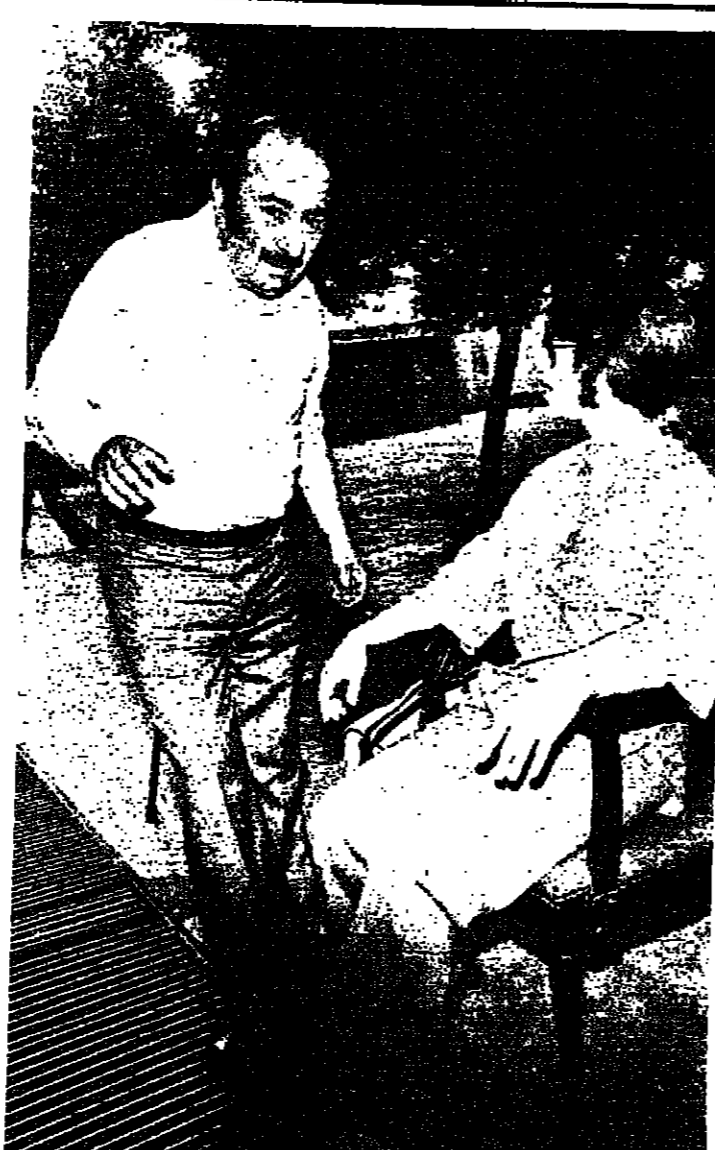
نيروز وعاصي الرحباني في لندن خلال الثمانين